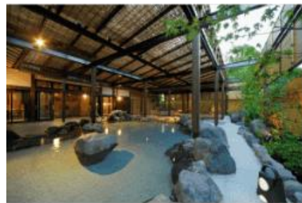
地域最大級の露天風呂（ニューウェルシティ湯河原）