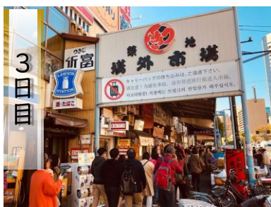
築地場外市場（イメージ）