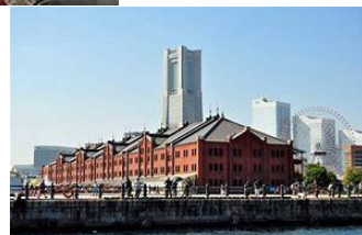
横浜赤レンガ倉庫と 横浜ランドマークタワー