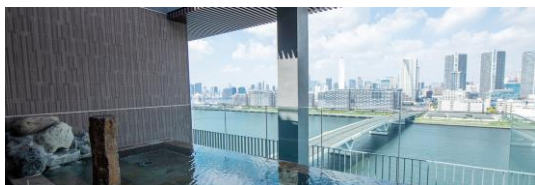
きらめく海とビルの光を眺めながら 最上階の温泉大浴場でリフレッシュ （ラビスタ東京ベイ）