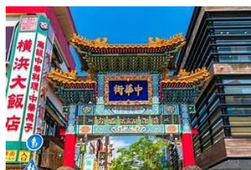
横浜中華街（昼食と散策）