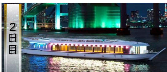
ご夕食は屋形船にて