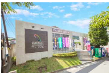
箱根駅伝ミュージアム