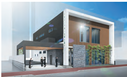
家族葬ホール、法事会館としてご利用ください

メモリードホール福大通り 福岡市城南区神松寺3丁目12-21 お問い合わせ 福大通り営業所 TEL : 092-834-2290