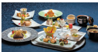
法事会館の料理イメージ

法事会館として11月15日、オープンします。家族葬ホール(30名様)、法事室(1室)、法要室(1室)があり、福岡で初の厨房を兼ね備えタイプのホールです。会館法要や他会館へ仕出しのご提供が可能になります。