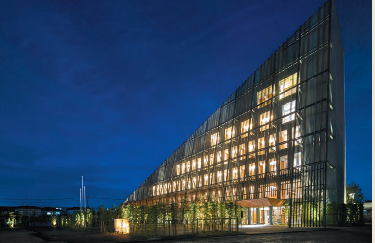
三角形のフォルムが特徴的なホテル

10月31日、長崎、宮崎に続く「ガーデンテラス」を冠するホテルがグランドオープンしました。 27のバンケット、スイートルームを含む34の客室を備えた県下最大級のラグジュアリーなシティホテル。