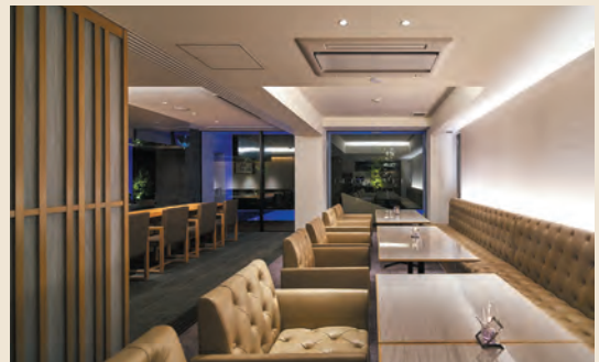
宿泊のお客様のみがご利用できるクラブラウンジ