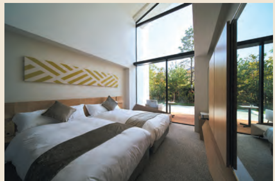
佐賀伝統の佐賀錦をモチーフに。スタンダードツインは18室

佐賀市新栄東3-7-8 TEL : 0952-23-0111 車で、JR佐賀駅南口より約8分、九州佐賀国際空港より約30分、 佐賀・大和ICより約20分