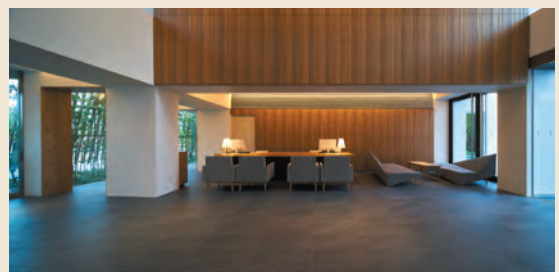
ゆったりとしたロビーでお出迎えます