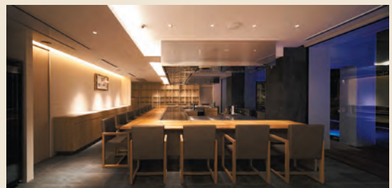
佐賀牛など佐賀の旬の食材と銘酒を満喫できる「鉄板焼ダイニング 佐賀竹彩」