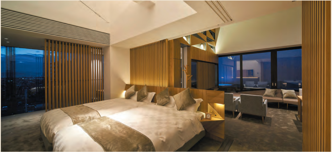
6階に1部屋だけのスイートルーム。テラスには屋外ジャグジーも

佐賀県内最大数27の会場を備えたバンケットゾーン、スイートルームなど34の客室があるホテルゾーン、ホテル一体型テラススタイルウェディングの舞台となるウェディングゾーンや2つのレストランなどを有する「ガーデンテラス佐賀 ホテル&マリトピア」。